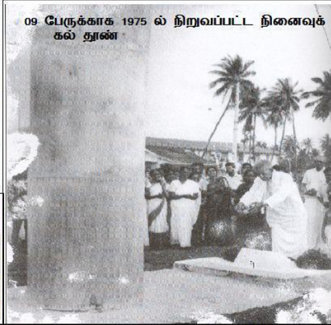
09 பேருக்காக 1975 ல் நிறுவப்பட்ட நினைவுக் கல் தூண்