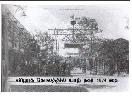
விழாக் கோலத்தில் யாழ் நகர் 1974 தை