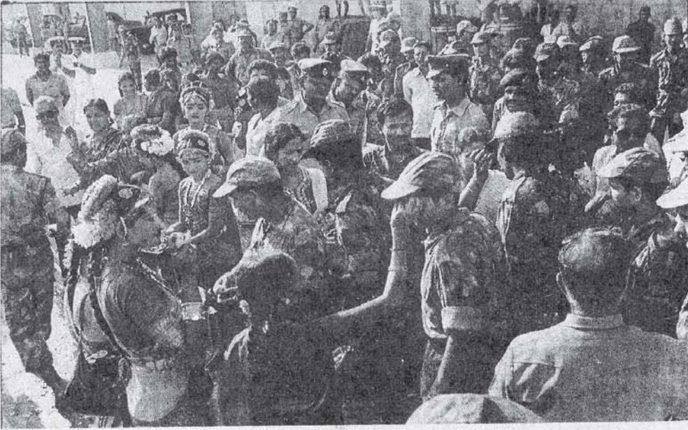
போன மச்சான் திரும்பி வந்தான் பூ மணத்தோட; ஈழ ஆக்கிரமிப்பிற்கு பிறகு, தப்பிவரும் இந்திய ராணுவத்தின் நெற்றியில் வெற்றி திலகமிட்டு வரவேற்கிறார்கள் சென்னை 'குடி' மக்கள் 'குடும்ப' பெண்கள். விடுதலை புலிகளால் வரலறுபட்டாலும், கொலை, கொள்ளை, கற்பழிப்பு, கடத்தல் இவற்றில் வரலாறு காணாத சாதனை புரிந்ததால் இந்த மகத்தான வரவேற்பு.

6 து நடந்து விடக்கூடாது என்று இந்திய பாசிச ராஜீவ் கும்பல் அஞ்சிக் கொண்டிருந்ததோ அது நடந்துவிட்டது! "நீ நாட்டாண்மை பார்த்தது போதும்; கிடைக்கு இரண்டாடுகளைக் குதறியது போதும்; இனி எங்கள் விவகாரங்களை நாங்களே பார்த்துக் கொள்கிறோம். நீ வெளியேறிவிடு!" என்று ஏகமான குரலில் இலங்கை மக்கள் அறிவித்து விட்டனர். இந்திய இராணுவம் வெளியேறுவதற்காக ஒரு மாதம் கெடுவைத்துள்ளது ஜே.வி.பி. அதிபர் பிரேமதாசா கொஞ்சம் 'தாராள' மனது வைத்து இரண்டு மாத அவகாசம் கொடுத்துள்ளார். ஓரிரு கைக்கூலி - துரோக கும்பல்கள் தவிர பூர்வாவோவின் சுதந்திரக் கட்சி, இலங்கை போலிக் கம்ப்யூனிஸ்டு கட்சி உட்பட அனைத்து சிங்கள, தமிழ், முஸ்லீம் மக்கள் அமைப்புகளும் இந்திய இராணுவம் வெளியேறிவிட வேண்டும் என்கின்றன.